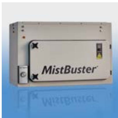
MistBuster® 500 Media