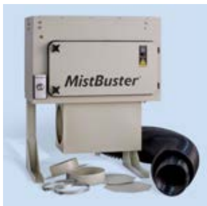
MistBuster® mit Anschlussplenum