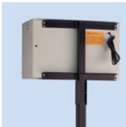
Steher für Maschinen- oder Bodenmontage